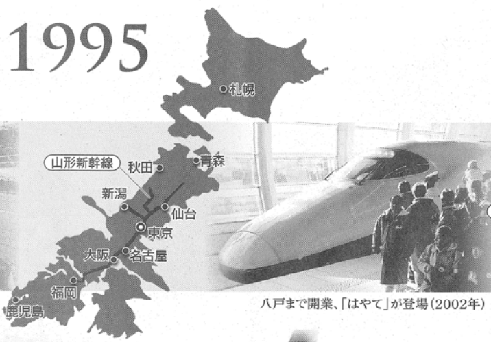
八戸まで開業、「はやて」が登場(2002年)