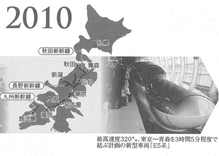
最高速度320km/h、東京―青森を3時間5分程度で結ぶ計画の新型車両「E5系」