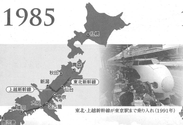
東北・上越新幹線が東京駅まで乗り入れ(1991年)